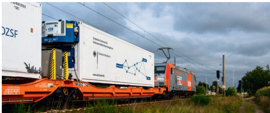
3: Versuchsfahrt Kühlcontainer

Mit der Eröffnung des Offenen Digitalen Testfeldes wurde der erste Schritt zum Aufbau einer allgemein zugänglichen For-