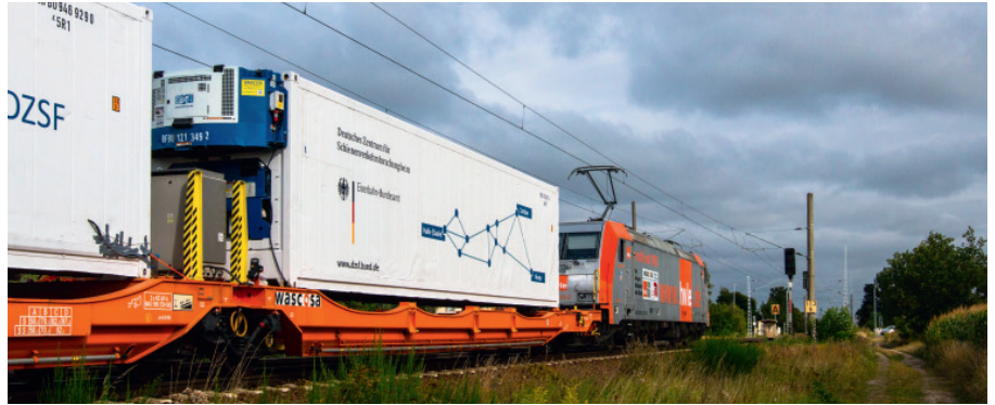
3: Versuchsfahrt Kühlcontainer

Mit der Eröffnung des Offenen Digitalen Testfeldes wurde der erste Schritt zum Aufbau einer allgemein zugänglichen For-