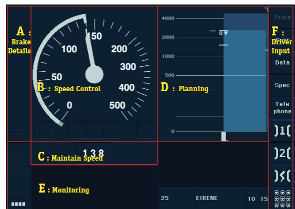
Abb. 3: Integrierte Informationen im DMI (UIC, 1998, S. 5)

Das Konzept des Situationsbewusstseins wurde bereits sowohl auf den manuellen als auch auf den automatisierten Bahnbetrieb angewandt, z. B. am Arbeitsplatz des Fahrdienstleiters (z. B. Golightly et al., 2010; Lo et al., 2016; Sharples et al., 2011), des Triebfahrzeugführers (z. B. Brandenburger & Naumann, 2019; Rose et al., 2018) oder im Kontext von Instandhaltung und Gleisbau (z. B. Golightly et al., 2013; Tretten et al., 2021). In all diesen Bereichen des Schienenverkehrs gibt es aus Sicht der menschlichen Informationsverarbeitung bereits eine beträchtliche Anzahl automatisierter Systeme und Prozesse. So überwachen beispielsweise Zugbeeinflussungssysteme die Geschwindigkeit und können (insbesondere in höheren Leveln) kontinuierlich Informationen aus der Infrastruktur bereitstellen, wie z. B. die Überwachung von Höchst- und Zielgeschwindigkeiten oder Bremszielpunkten. Diese Informationen werden unter Berücksichtigung menschlicher Faktoren (Metzger & Vorderegger, 2012) beispielhaft in das „Driver Machine Interface“ (DMI, siehe Abb. 3) integriert. Es handelt sich um eine standardisierte Schnittstelle zwischen Triebfahrzeugführer und Zug für das Europäische Zugsicherungssystem (ETCS), die die Entwicklung eines Situationsbewusstseins unterstützt.