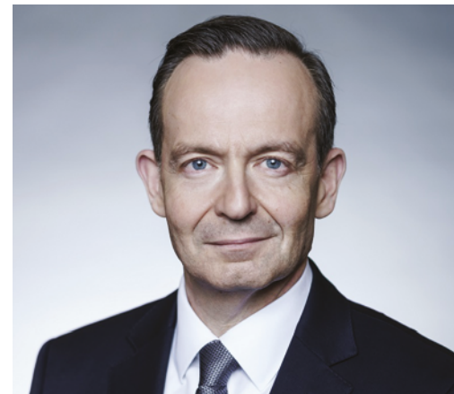
Dr. Volker Wissing MdB Bundesminister für Digitales und Verkehr