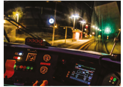
Mit dem Offenen Digitalen Testfeld wird Forschung unter Realbedingungen möglich.

Das Versuchsgebiet erstreckt sich über die Haupt- und Nebenstrecken im Streckennetz Halle – Cottbus – Niesky. Testfahrten und Versuche am Gleis und an Bahnanlagen stehen ebenso auf der Agenda wie Untersuchungen im Umfeld, bei denen es zum Beispiel um Fahrgäste, Anwohnerinnen und Anwohner sowie Umwelt geht. Die Versuche sollen vom DZSF selbst durchgeführt werden und im Rahmen von Auftragsforschungsprojekten genutzt werden. Das Testfeld steht darüber hinaus für wissenschaftliche Forschung und die Erprobung neuer Technologien zur Verfügung.