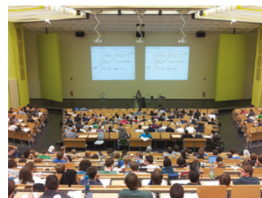
Zur Stärkung des Schienenverkehrssektors sind qualifizierte Fachkräfte unabdingbar.

Der Schienenverkehr ist das umweltfreundlichste Verkehrsmittel. Dieser Vorteil gegenüber anderen Verkehrsträgern soll ausgebaut werden und auch langfristig unter den sich verändernden klimatischen, demographischen, sozialen und technologischen Rahmenbedingungen eine wichtige Säule der Mobilität bleiben. Dazu sind weitere Anstrengungen zur Energieeinsparung, zur Nutzung regenerativer Energien und Senkung der Umweltauswirkungen für Anwohnerinnen und Anwohner sowie für den Schutz der Umwelt erforderlich. Das Verkehrsangebot muss fortlaufend den Veränderungen von demographischen Strukturen und Konsumverhalten sowie Warenströmen angepasst werden. Eine innovative Fortentwicklung des Bahnsystems setzt auch voraus, dass sich die damit verändernde Arbeitswelt auf die Bedürfnisse der Mitarbeiterinnen und Mitarbeiter einstellt und attraktive Berufsbilder anbietet.